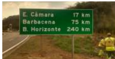
496 m² de novas placas