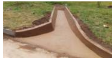
2.833 m de reparo em drenagens