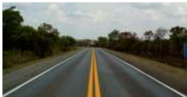
240 km de pintura de faixas