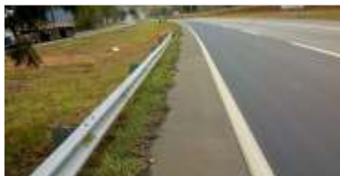
1.418 m de novas defensas metálicas