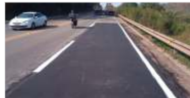
18 km de asfalto novo