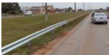
Novas defensas metálicas