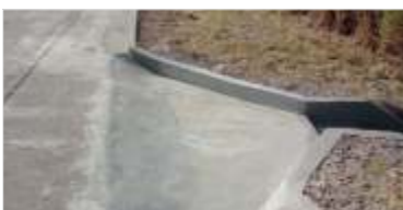
Recuperação de drenagem