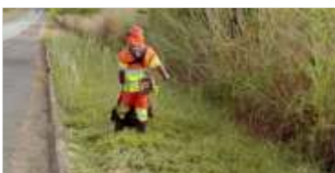
Conservação contínua da rodovia