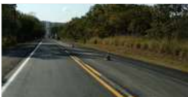
Revitalização de sinalização