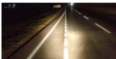
Pintura de faixas