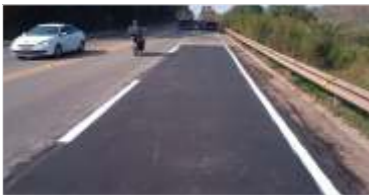
246 km de asfalto novo