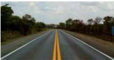
670 km de pintura de faixas