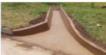
4.071 m de reparo em drenagens