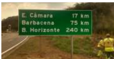
503 m 2 de novas placas