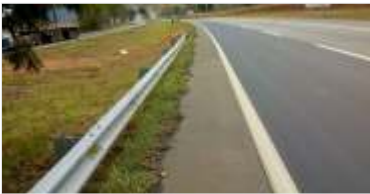
693 m de novas defensas metálicas