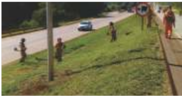
Conservação contínua da rodovia