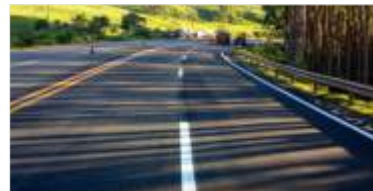
72 km de asfalto novo