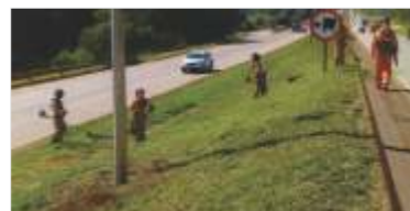
Conservação contínua da rodovia