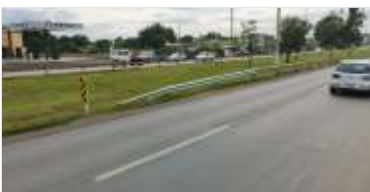
1.020 m de novas defensas metálicas