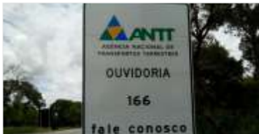
547 m² de novas placas