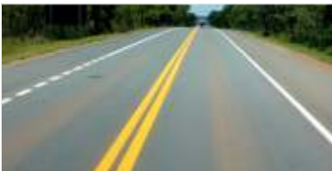
599 km de pintura de faixas