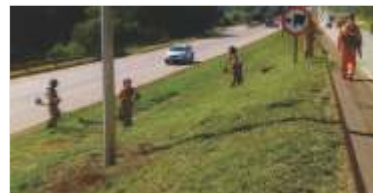
Conservação contínua da rodovia