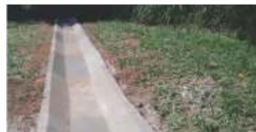
2.136 m de reparo em drenagens