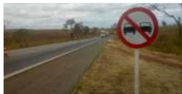
398 m 2 de novas placas