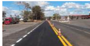
26 km de asfalto novo