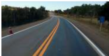
515 km de pintura de faixas