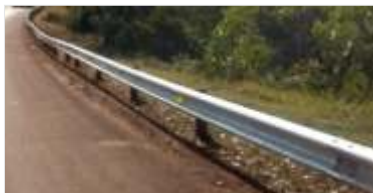
2.897 m de novas defensas metálicas