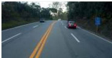
929 km de pintura de faixas