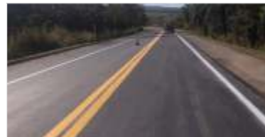
27 km de asfalto novo