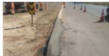
3.322 m de reparo em drenagens