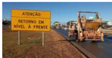
362 m 2 de novas placas