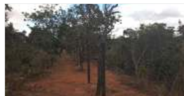
Conservação contínua da rodovia