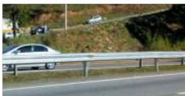
911 m de novas defensas metálicas