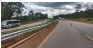
4.470 m de novas defensas metálicas