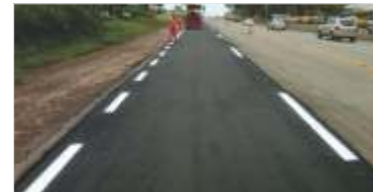
24 km de asfalto novo