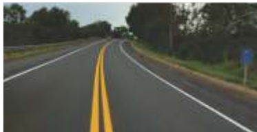
464 km de pintura de faixas