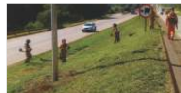
Conservação contínua da rodovia