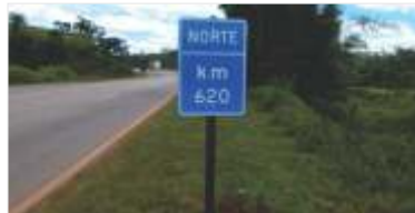
282 m 2 de novas placas