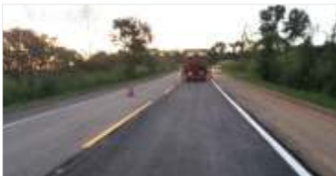
36 km de asfalto novo