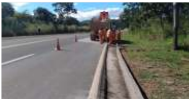
5.299 m de reparo em drenagens