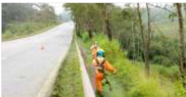
Conservação contínua da rodovia