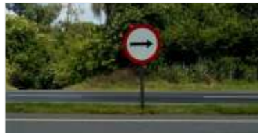
362 m² de novas placas