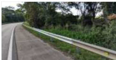
4.058 m de novas defensas metálicas