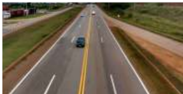
329 km de pintura de faixas