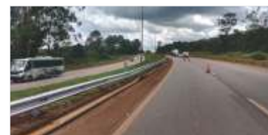
1.792 m de novas defensas metálicas