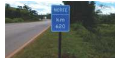
183 m 2 de novas placas