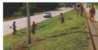
Conservação contínua da rodovia