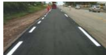
11,4 km de asfalto novo