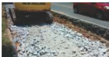
Reparo profundo do asfalto, na região de Juiz de Fora (MG)