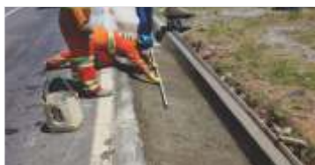
Manutenção contínua do sistema de drenagem