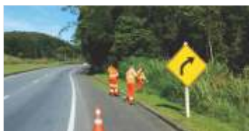
Serviço de conservação da via em Barbacena (MG)