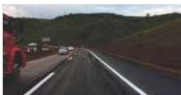
Melhoria de asfalto e sinalização na região de Itabirito (MG)