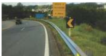
Manutenção de defensas metálicas em Santos Dumont (MG)