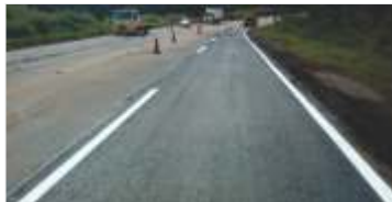
35 quilômetros de pistas recuperadas, incluindo nova sinalização