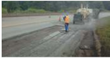
Intensificação dos trabalhos de melhoria de asfalto