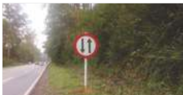
289 novas placas instaladas