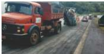
Reforço de equipes e equipamentos nos trechos de maior atenção