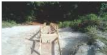
2.700 metros de reforma e implantação de drenagens