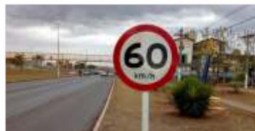
216 placas instaladas