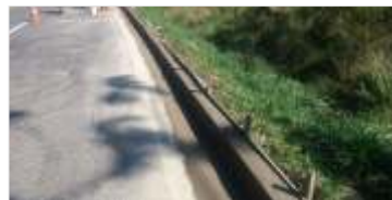
2.300 metros de reforma e implantação de drenagens