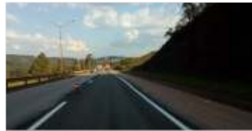
55 km de melhoria de asfalto