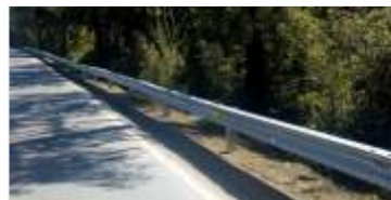
1.300 metros de defensas metálicas