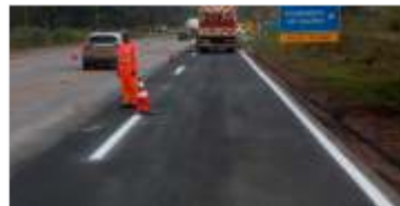
151 km de pintura de sinalização